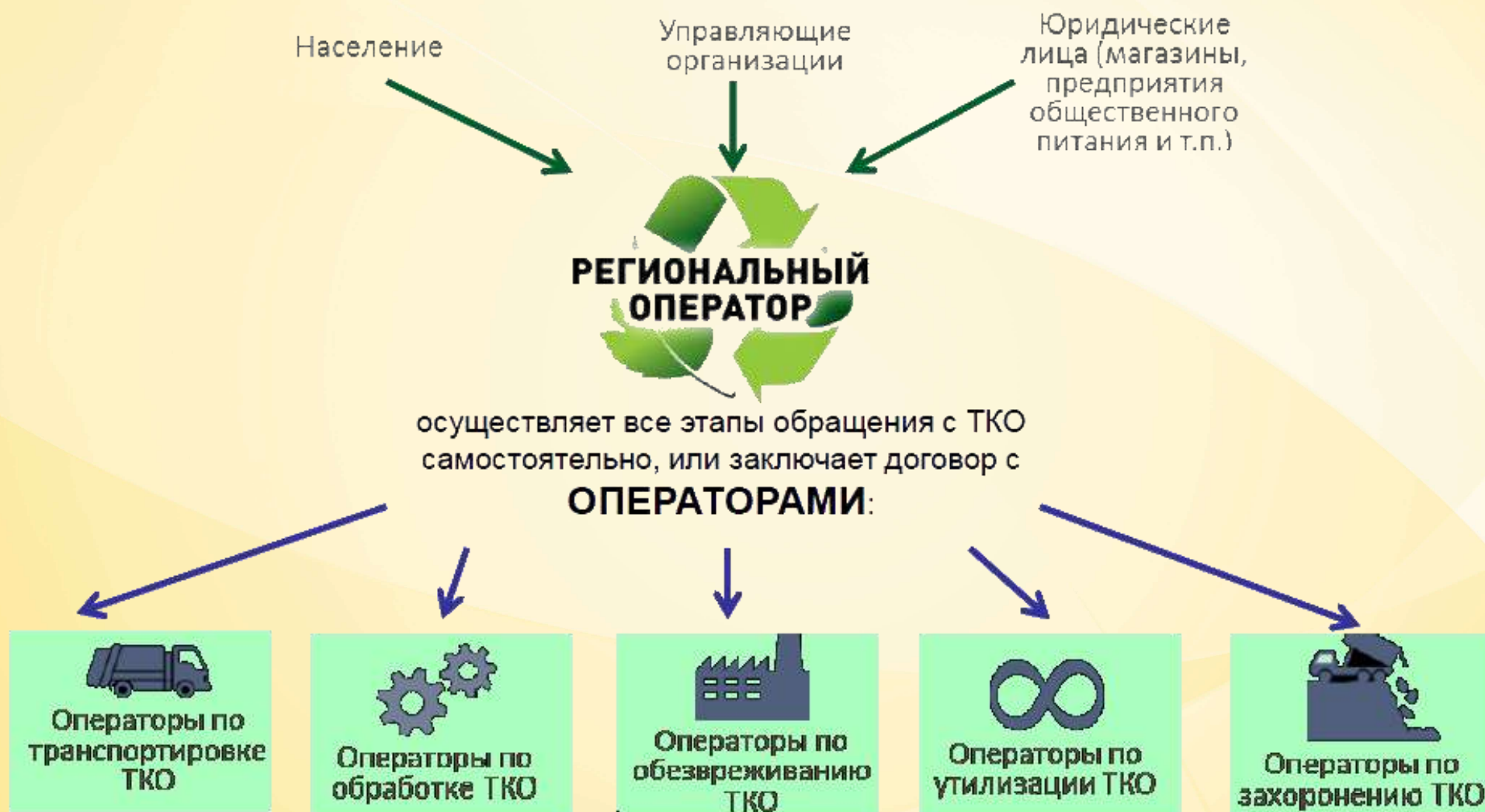
СХЕМА ДОГОВОРНЫХ ОТНОШЕНИЙ